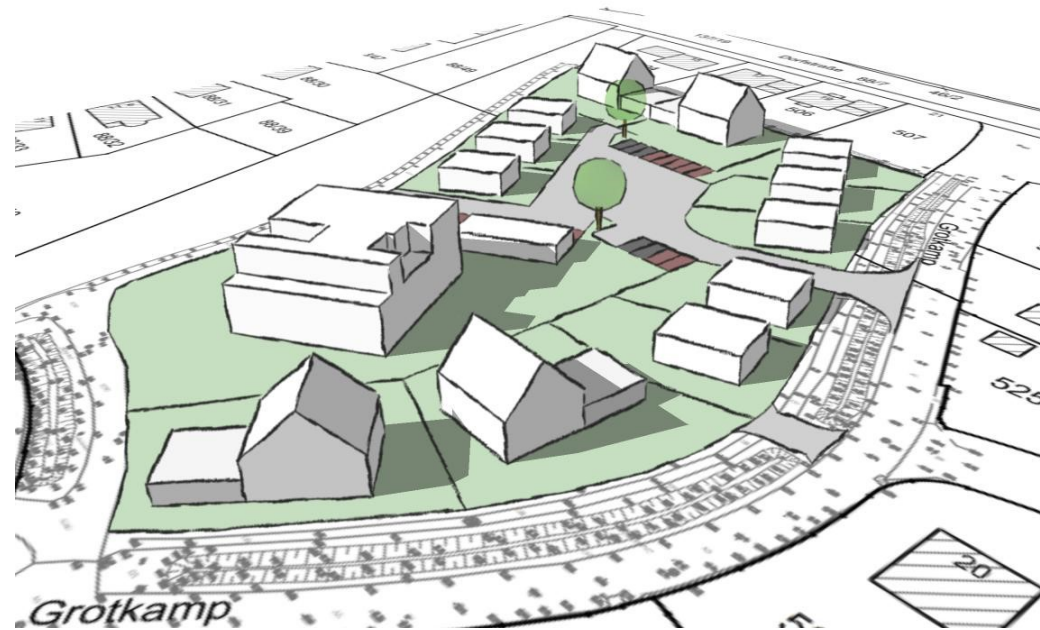
Ansicht aus Südosten