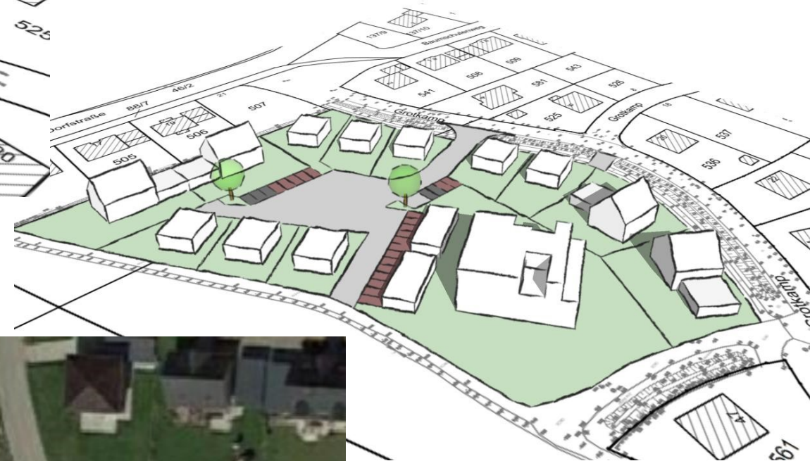
Ansicht aus Südwesten